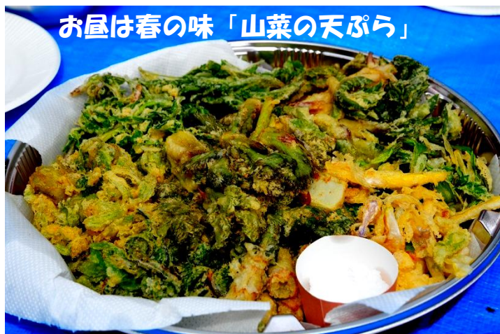
お昼は春の味「山菜の天ぷら」

開催日 4月22日(日) 時間 9:30~13:30 (9:15 受付開始) 集合 こしじ水と緑の会「緑の家」